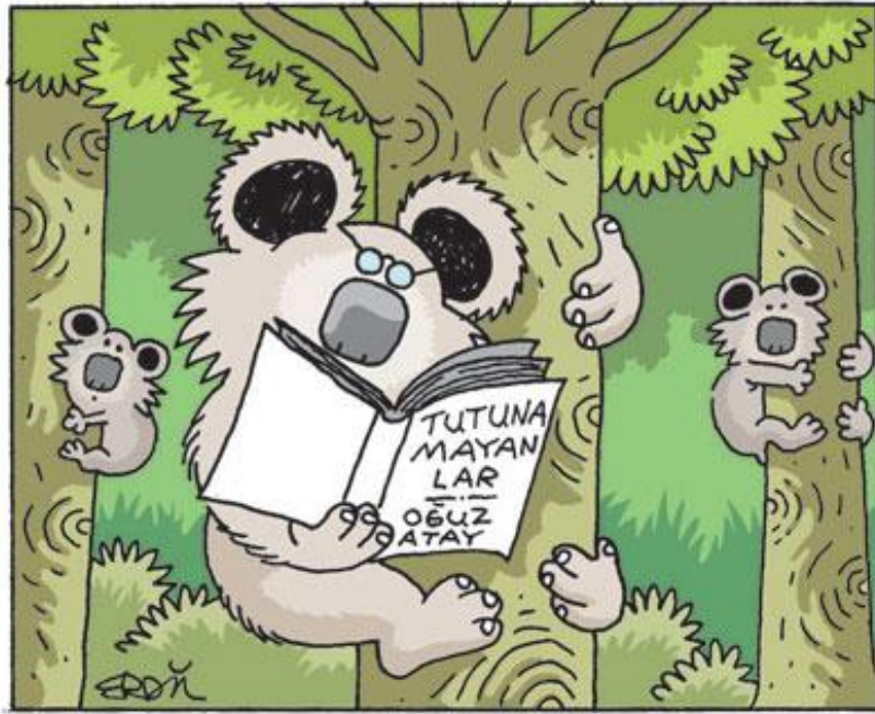
Erdil Yaşaroğlu © www.komikaze.net

tutunamayan, çaresizliğe sürüklenmiş, negatif kişiler olduğu hakkında bilgi verir. Oğuz Atay'ın "Tutunamayanlar" başlıklı romanı hakkında bilgi verir. Bu romanın kişilerini, konusunu, izlediğini ve kurgusunu anlatır ve aşağıdaki karikatürü yansıtıcı ile öğrencilerine gösterir.