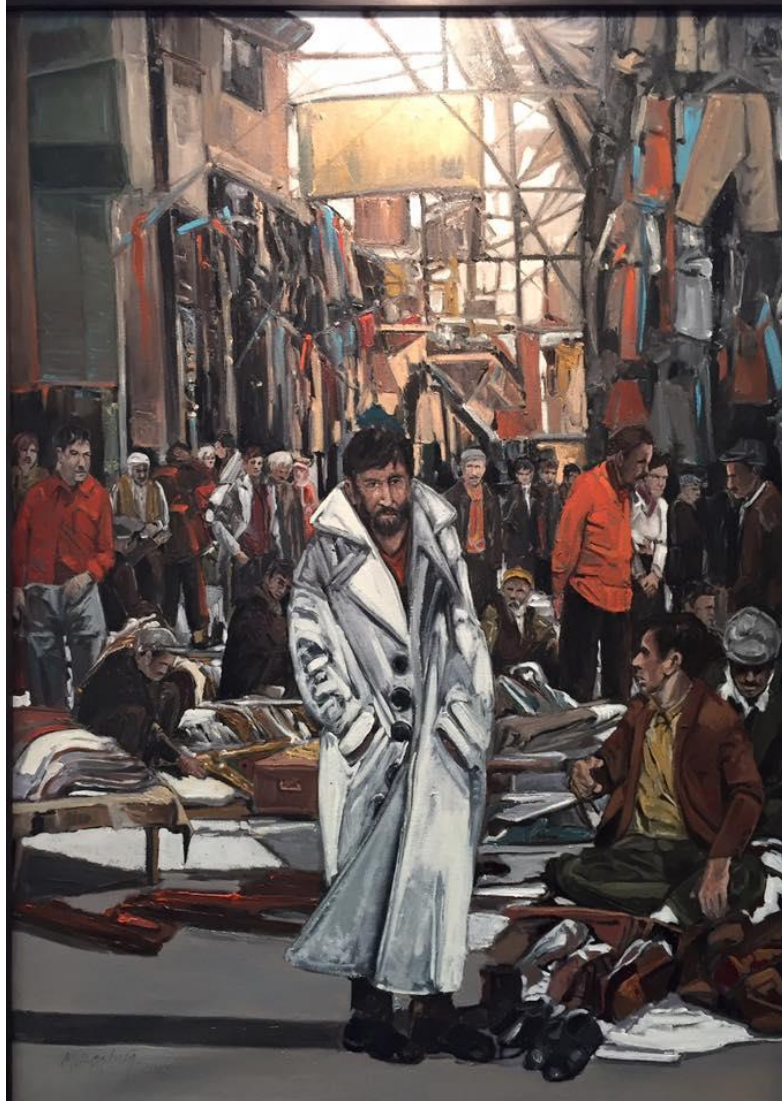
Şekil 1. Mehmet Başbuğ. Beyaz Mantolu Adam,

Etkinlik 1. Öğretmen öğrencilere “Beyaz Mantolu Adam” başlıklı yağlı boya tabloyu yansıtıcı ile gösterir ve “Gördüğünüz resimden yola çıkarak bir sonraki ders ele alacağımız öyküyü tahmin etmeye çalışın” der. Öğrencilere düşünmeleri için beş dakika verir. “Beş dakika sonunda tahminlerinizi deftere yazın” der.